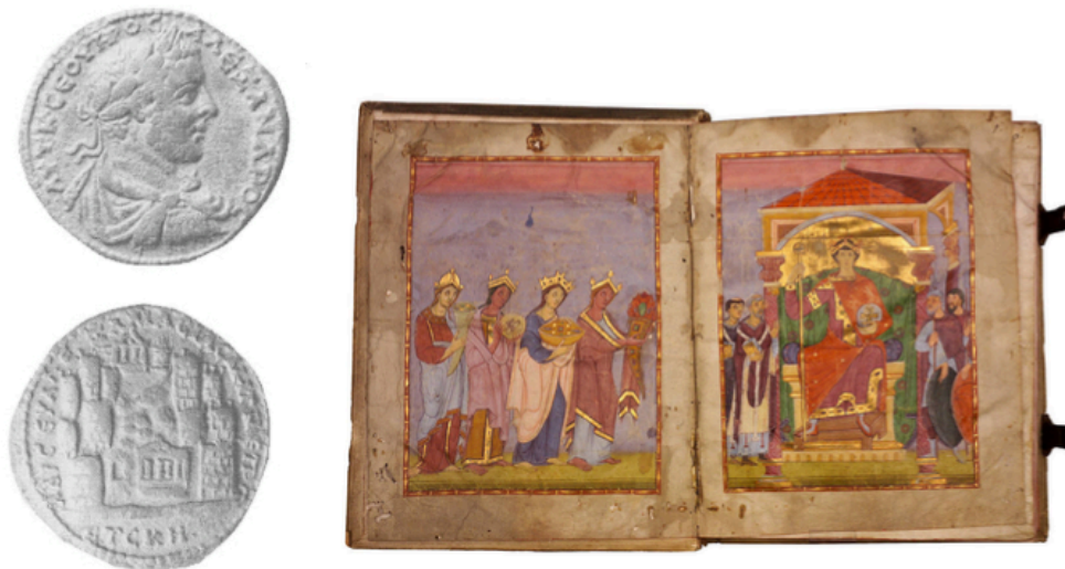
Monnaie de l'empereur Sévère Alexandre, 225-226 p.C. (Amasya, Musée archéologique) L'hommage à l'empereur, IXe siècle. (Staatsbibl. Bamberg, Msc. Class. 79, double page initiale)